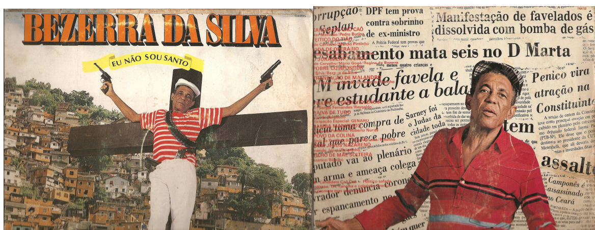
FOTO 19 - Sambista Pernambucano Referência para Os Rappers Brasileiros

Fonte: Arquivo Pessoal. Tirada do disco Eu não sou Santo , em 04/11/1998.