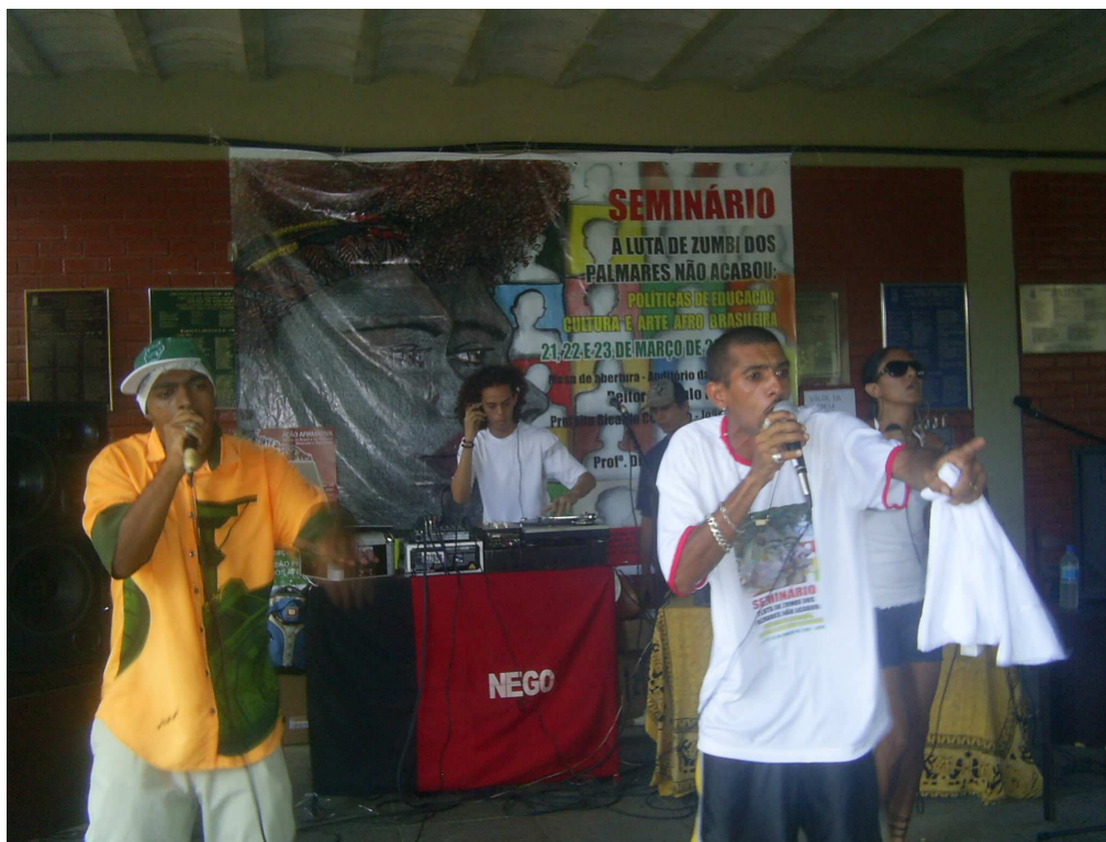
FOTO 18 - Grupo SDS Ativismo no Seminário A Luta de Zumbi Na UFPB.

Tirada em 21/03/2007.