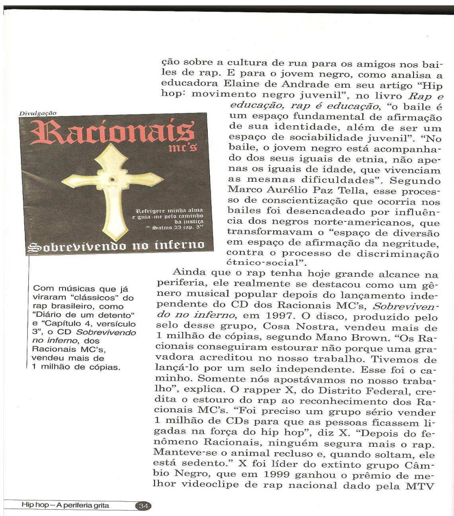
FOTO 22 – Capa do CD Sobrevivendo no Inferno do Grupo Racionais M'Cs.