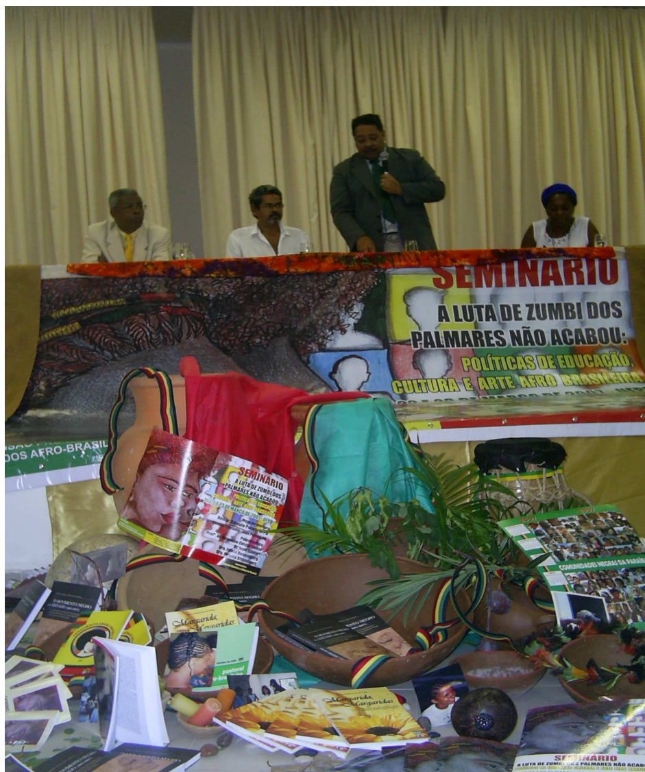
FOTO 21 - Seminário a Luta de Zumbi dos Palmares não acabou na UFPB

Fonte: Arquivo pessoal. Tirada em 20/03/2007.