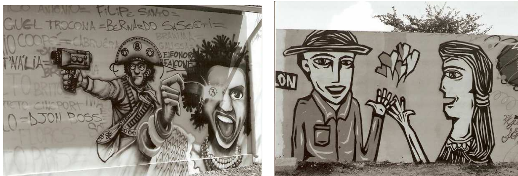
FOTO 8 - GRAFFITE em foto preto em branco influenciado pela XILOGRAVURA

Fonte: Arquivo pessoal. Tirada em 17/10/2007.