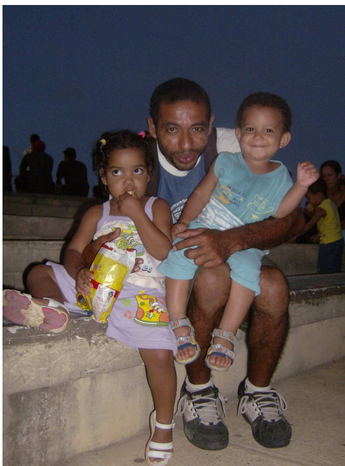
Tirada em 23/11/2007.